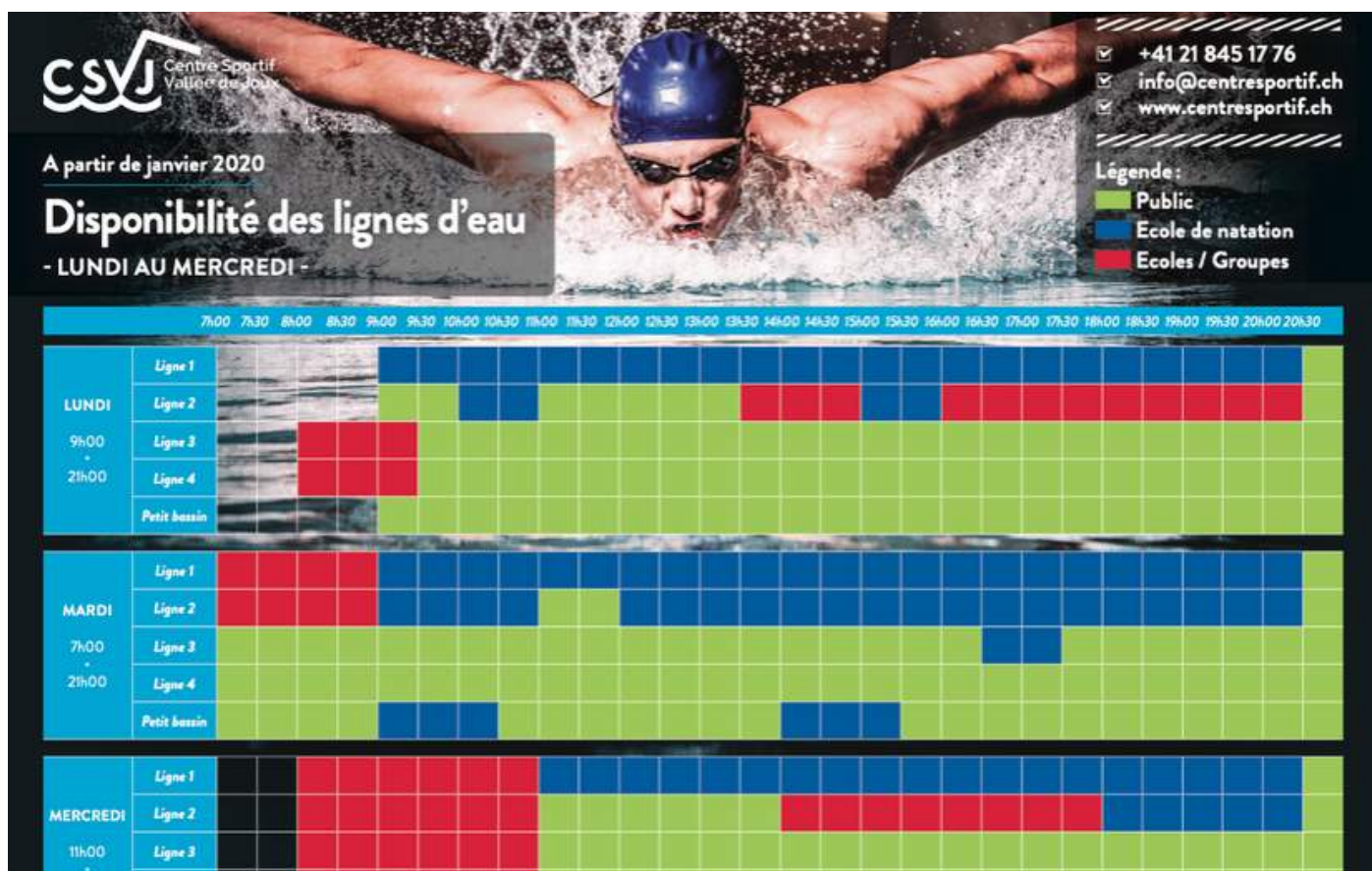
Planning de l'occupation des lignes d'eau