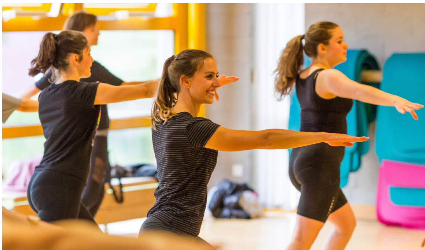
Cours de danse moderne