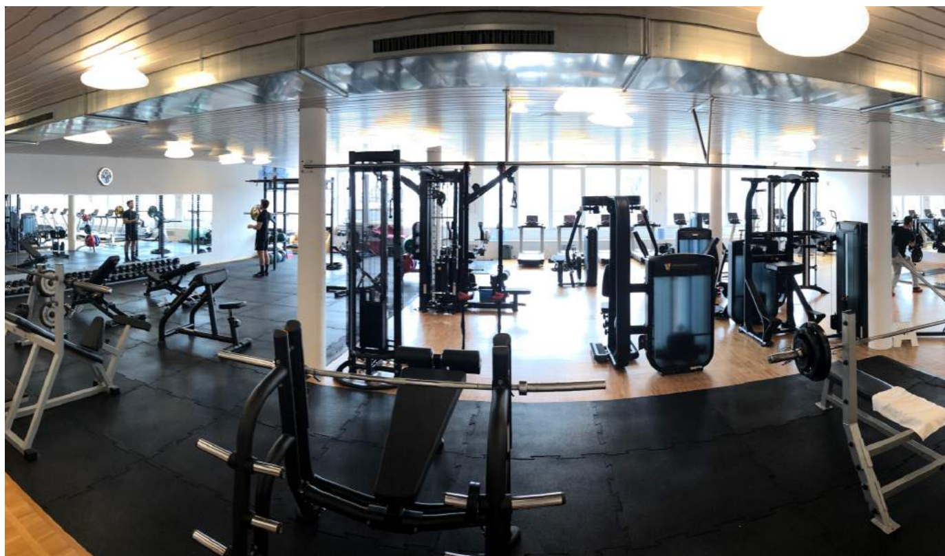
Nouvelles machines Matrix