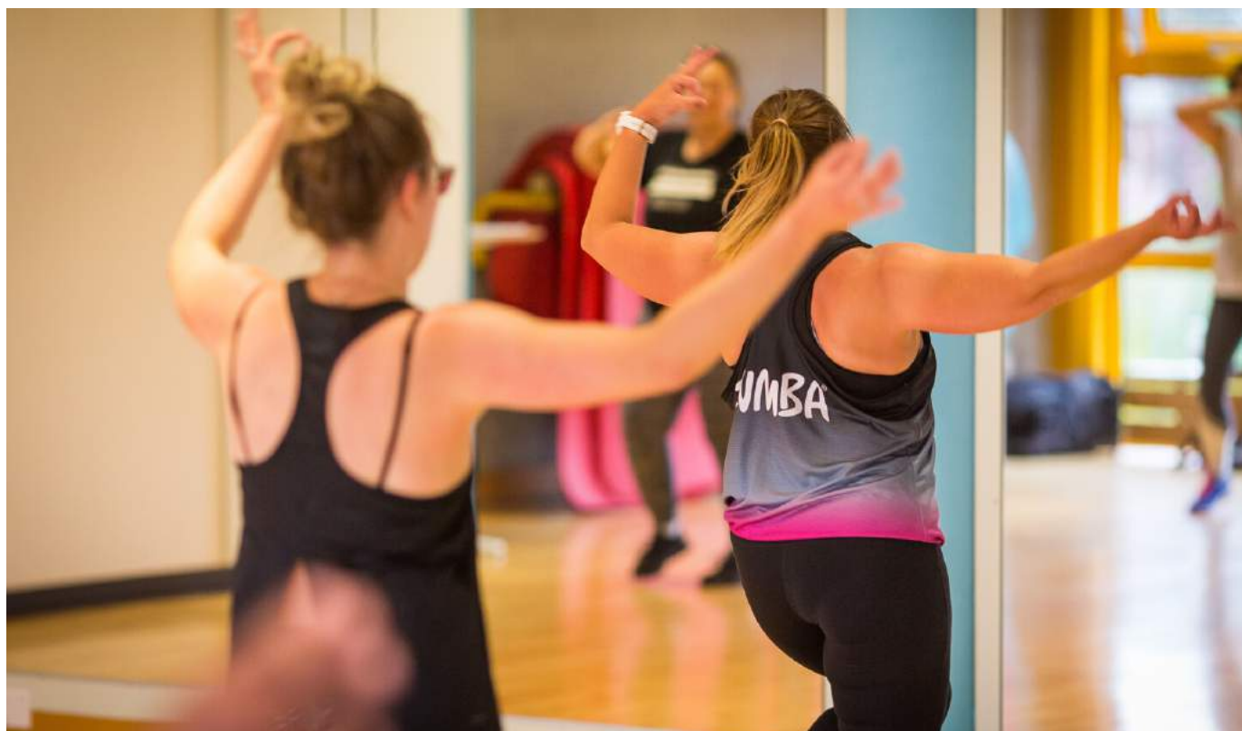
Cours de Zumba